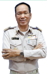
นายอนุทิน หมั่นงาน