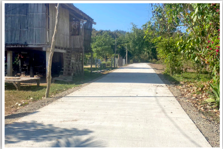
หลังดำเนินการก่อสร้าง