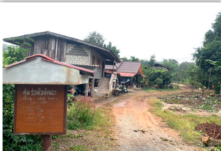
ก่อนดำเนินการก่อสร้าง