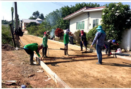
ก่อนดำเนินการก่อสร้าง