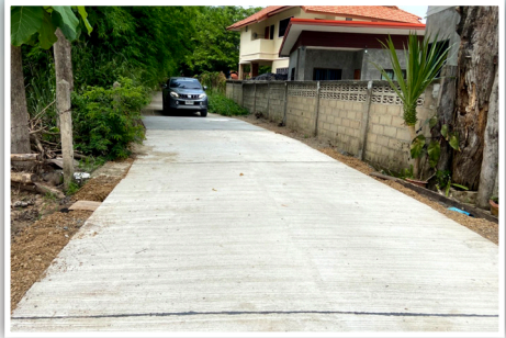
หลังดำเนินการก่อสร้าง