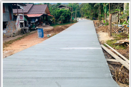
หลังดำเนินการก่อสร้าง